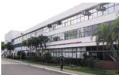
A fábrica de Campinas (SP) controla e assegura a qualidade de toda a Linha de Freios Bosch.

Tudo o que a Bosch fabrica e fornece para o mercado brasileiro passa por rigorosa seleção, testes e inspeção na unidade de Campinas. Dessa forma, os discos e tambores de freio Bosch proporcionam a máxima segurança e desempenho no momento da frenagem.