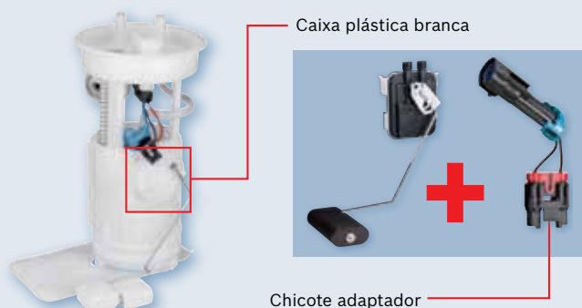
Caixa plástica branca

Para substituir o sensor de nível antigo, com caixa plástica branca, é necessário chicote adaptador.