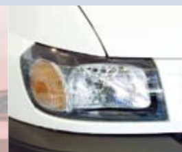
Ford Transit V