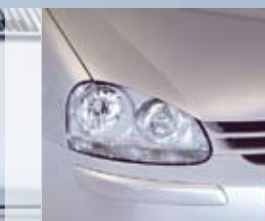
VW Golf V (Bi-Xenon)